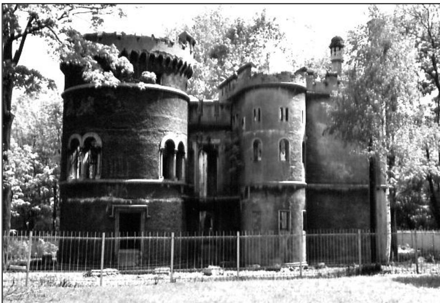
Współczesny wygląd ruin

zamkowy został udostępniony mieszkańcom Miechowic, wówczas już dużej gminy o charakterze miejskim w sąsiedztwie Bytomia.