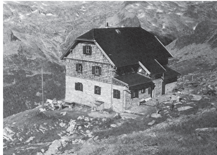
Schronisko Kattowitz Hütte na Grosser Hafner

w tym regionie, jednak „starszyzna” zdecydowała o wyborze Alp – zgodnie z nazwą i tradycją Towarzystwa. Wybrano odciepy dwiema granicami państwowymi teren u podnóża Grosser Hafner. Budowa była trudna, bo dojazd z Katowic był bardzo ciężki,